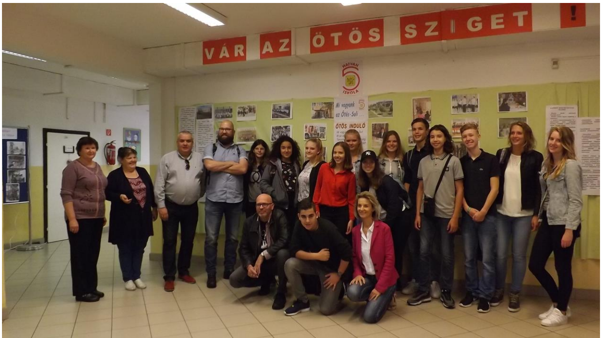
A 2016/2017. tanévben holland testvérvárosunk diákjai és tanárai töltöttek egy napot az Ötös-Suliban.

Városunk Testvérvárosi kapcsolataikat ápoljuk, rendszeres vendégeink az ide látogató külföldi csoportok.